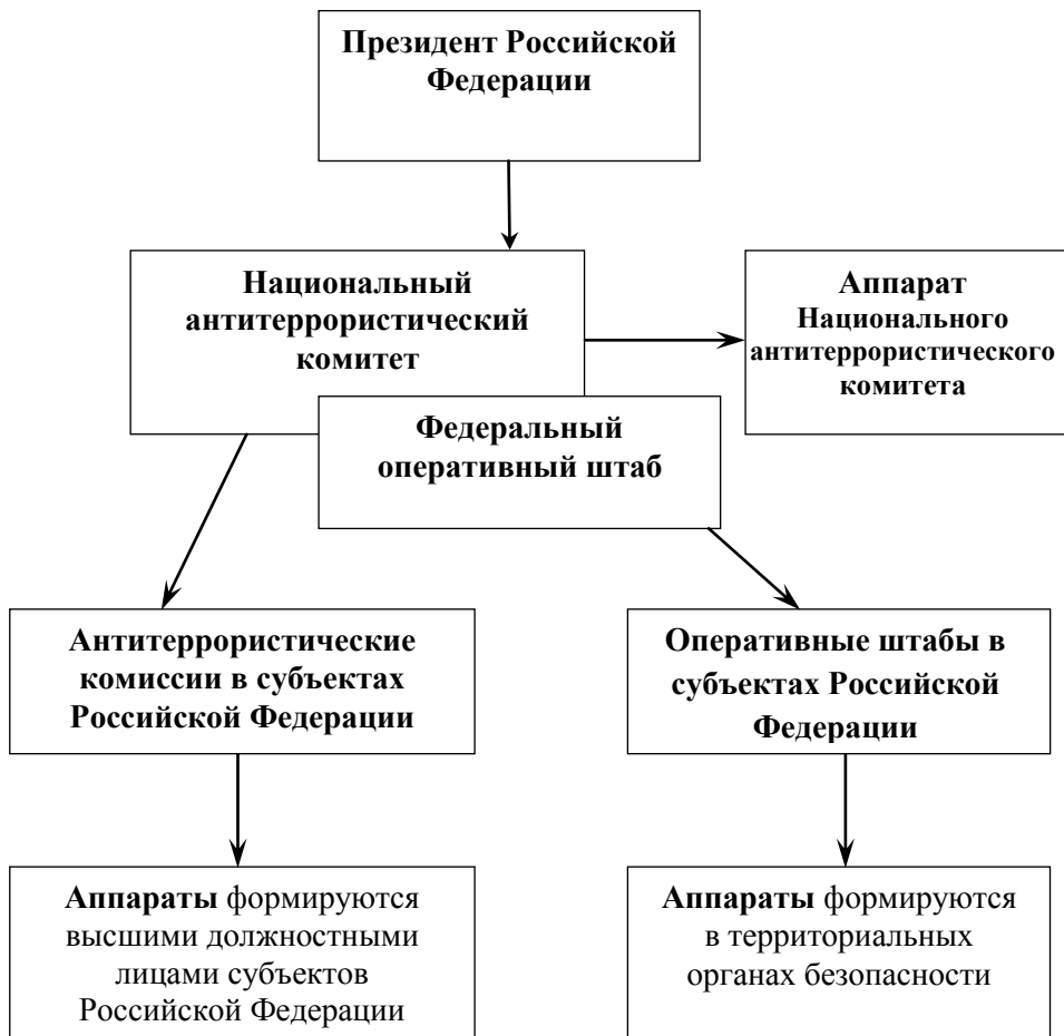
Рисунок 3 – Схема координации деятельности по противодействию терроризму в Российской Федерации